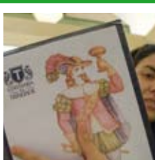
Cervejaria da Trindade

Een vintage collector's item scoren bij deze hippe winkel.