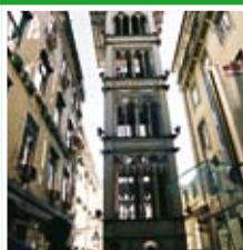
Elevador de Santa Justa

Een Portugese 'bife' eten in dit sfeervolle bierhuis.